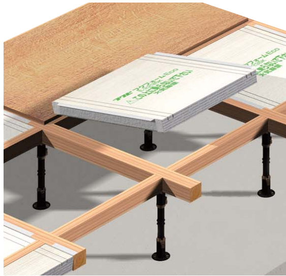
根太無し格子組納まり