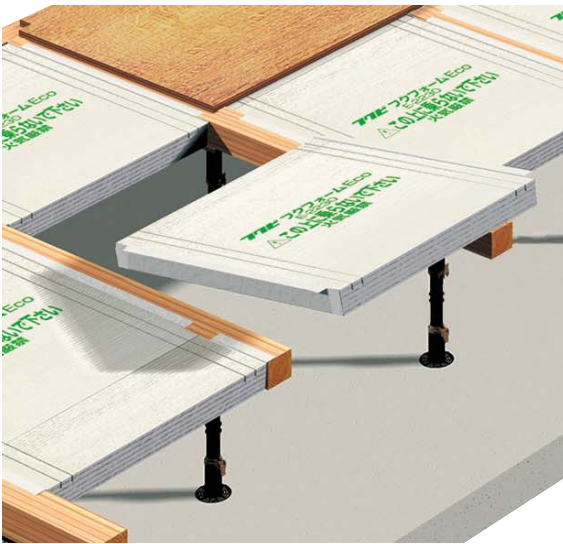
根太無し一般組納まり