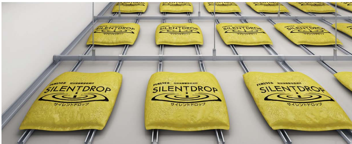
天井裏施工イメージ