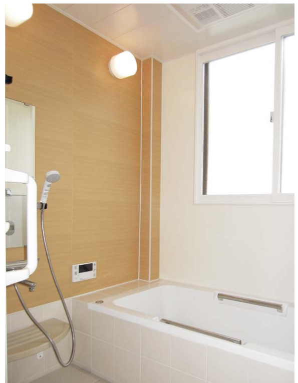
施工例:アルバレージ 左面 TK, 右面 WW