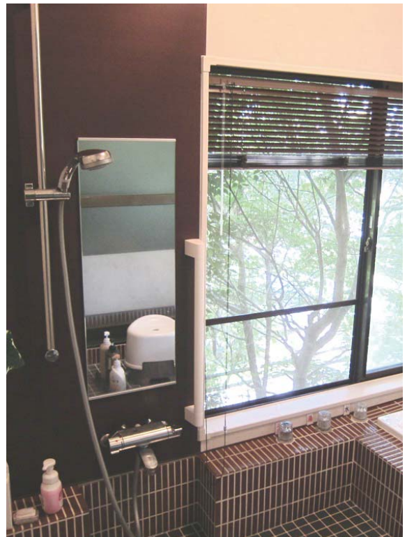
施工例:左面 [TR]、右面 [SJ]