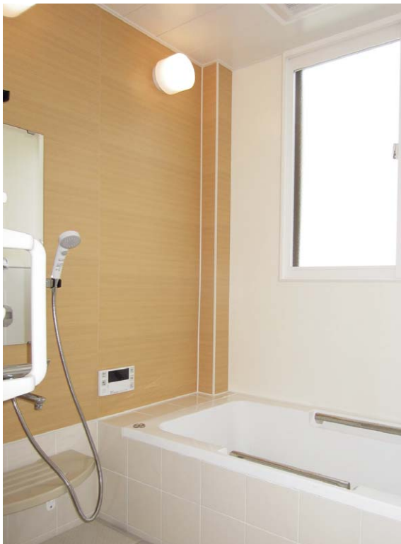
施工例:左面 [TK]、右面 [WW]

耐震制震 床基礎の気密断熱 遮熱透湿防水 開口仕設備 換気システム 換気器具材 スハドレル 浴室水廻り 点検口枠 易昇下材 内装建材 養生保安 外装建材 左官資材 乾式二重床 リノビオ 床仕上げ材 その他