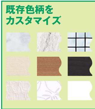
既存色柄を カスタマイズ