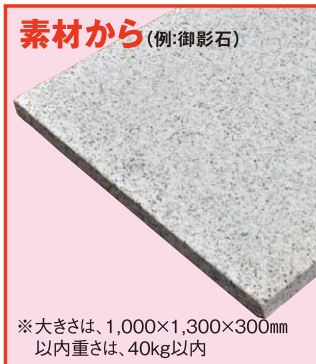
素材から (例:御影石)