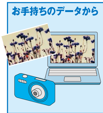
お手持ちのデータから