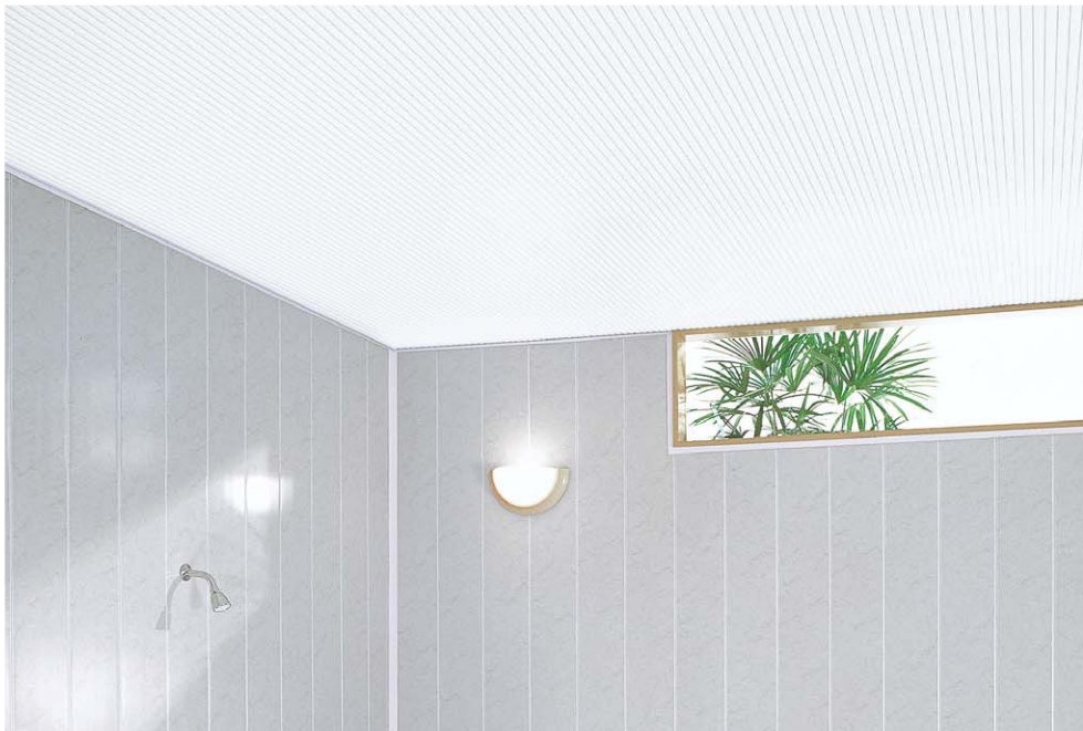
施工例: W ホワイト