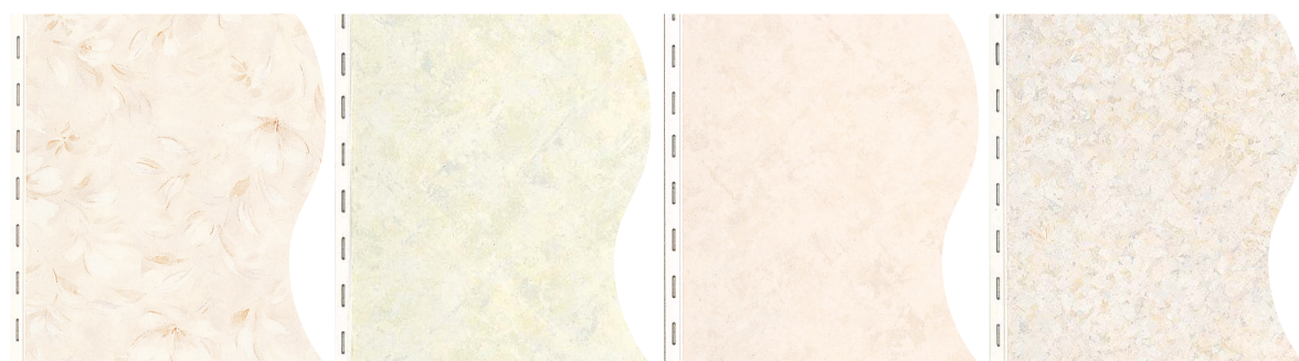
FV フリージアベージュ RY ルミエールイエロー RK ルミエールピンク R ロートシエス