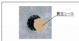
※養生シールは同梱タイプのみ。