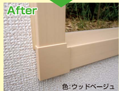
色:ウッドベージュ