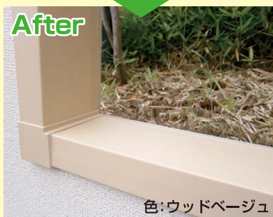
色:ウッドベージュ