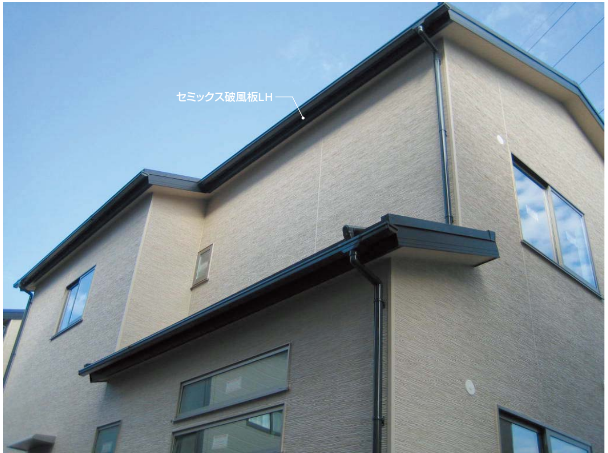
セミックス破風板LH