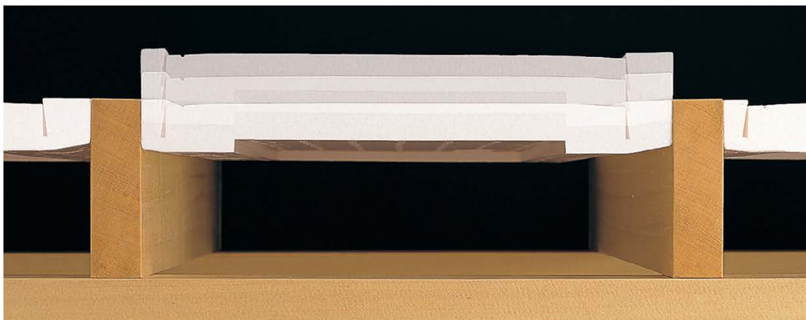
フクフォーム ツーバイフォー