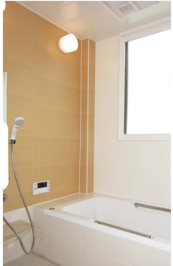
施工例:アルバレージ 左面 TK、右面 WJ