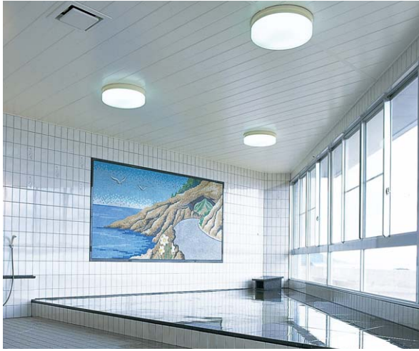
施工例: WJ ホワイト

耐震制震 床基礎の気密断熱 遮熱透湿防水 開口住設備 換気システム 換気器材 スラントレール 浴室水廻り 点検口枠 易吊下地材 内装建材 養生保安 外装建材 左官資材 乾式・重床 システム等 床仕上げ材 その他