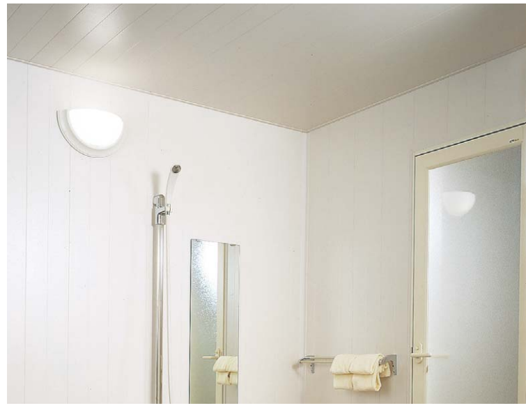
施工例 天井・壁・W ホワイト