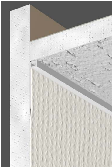
「天井一壁」納まり例 (フリー勾配スライド見切 3T)