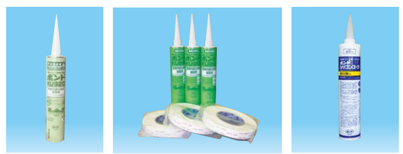
●接着剤 ●TMセット ●シーリング材※ ※ホワイト色の他にグレー、ベージュ色もご用意しています。