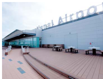
東京国際空港国際ターミナルビル 展望デッキ 東京都大田区 2010年10月