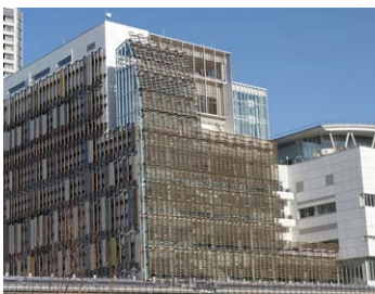
みなとパーク芝浦 ルーバー 東京都港区 2014年10月