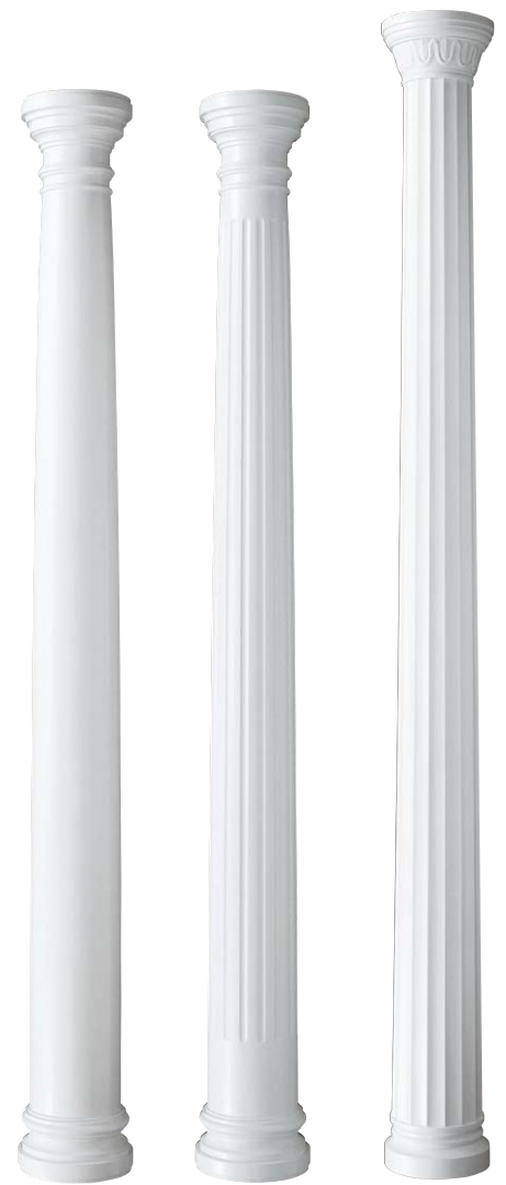
●EH01 (トスカナ式) ●EH02 (ドリス式) ●EH03 (ドリス式)