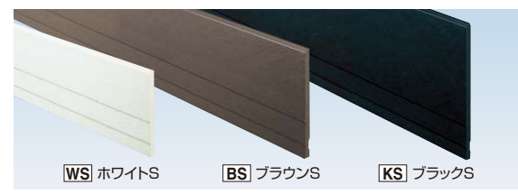
WS ホワイトS BS ブラウンS KS ブラックS