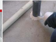
●アリダンコーキング