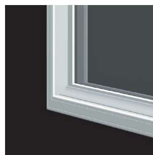
オプションで裏側下部にRを付けることもできます。